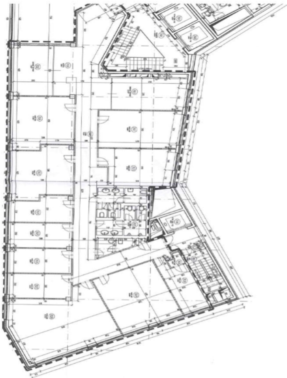
2. patro | 2nd floor