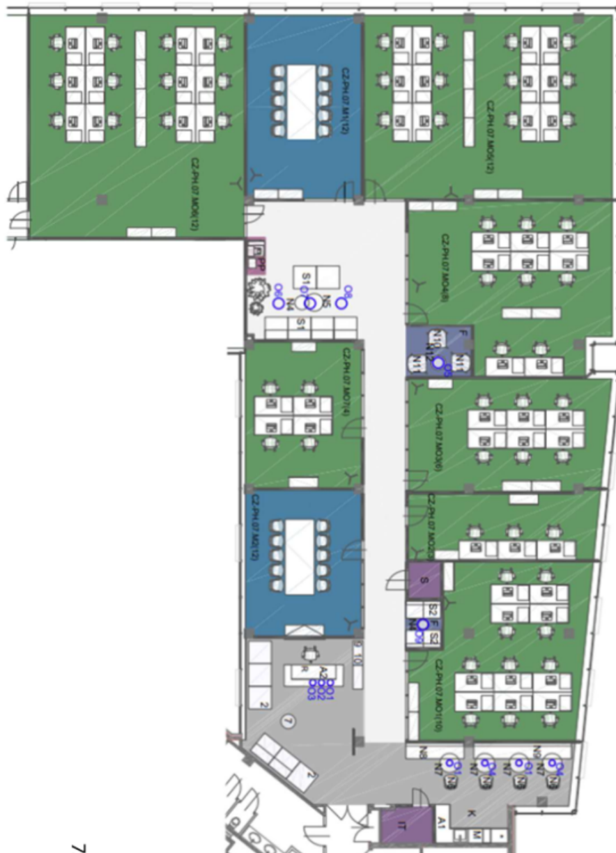
7. patro / 7th floor