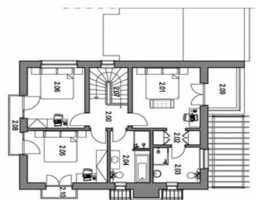
PŮDORYS 2. NP FIRST FLOOR