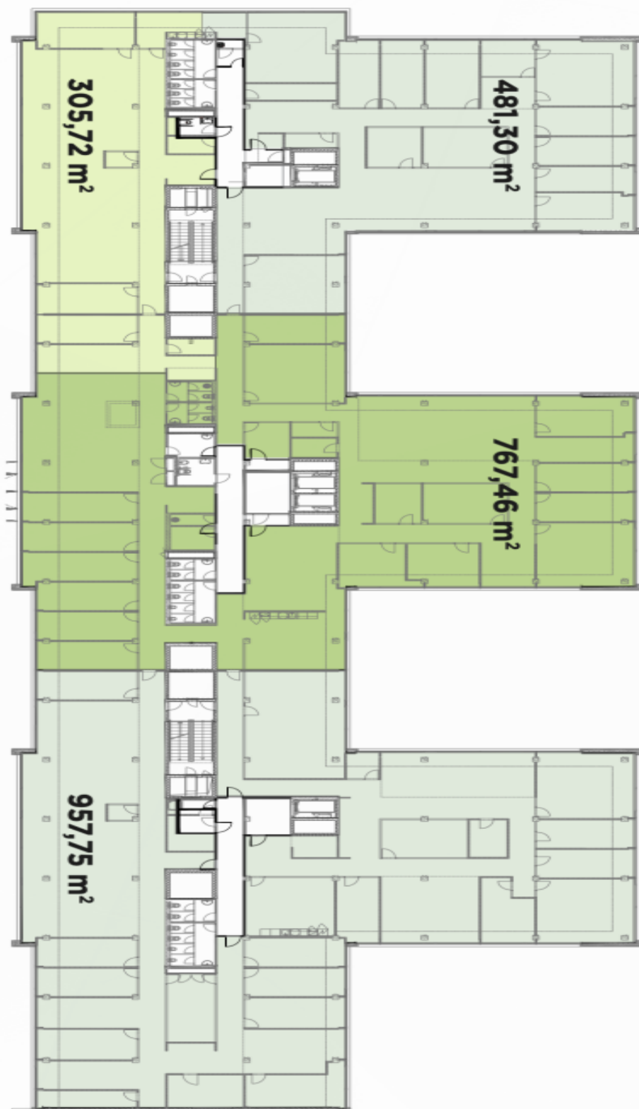
PŘÍKLAD DĚLENÍ PROSTOR