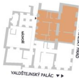
UMÍSTĚNÍ V RÁMCI PODLAŽÍ