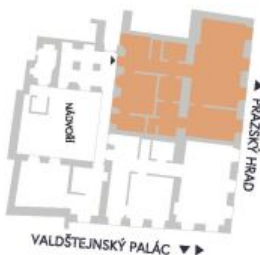
UMÍSTĚNÍ V RÁMCI PODLAŽÍ