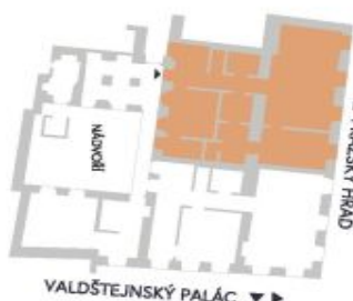
UMÍSTĚNÍ V RÁMCI PATRA