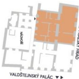
UMÍSTĚNÍ V RÁMCI PODLAŽÍ