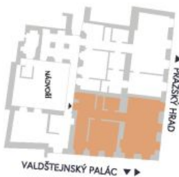
UMÍSTĚNÍ V RÁMCI PODLAŽÍ