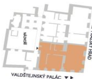
UMÍSTĚNÍ V RÁMCI PATRA