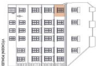
UMÍSTĚNÍ V RÁMCI PODLAŽÍ