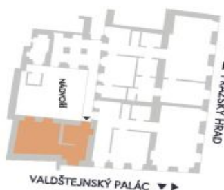
UMÍSTĚNÍ V RÁMCI PATRA