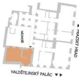
UMÍSTĚNÍ V RÁMCI PODLAŽÍ