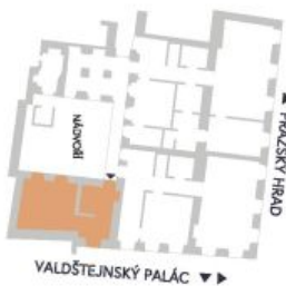
UMÍSTĚNÍ V RÁMCI PODLAŽÍ