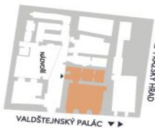
UMÍSTĚNÍ V RÁMCI PATRA