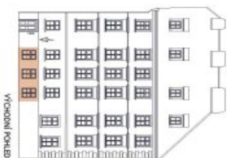
UMÍSTĚNÍ V RÁMCI PODLAŽÍ