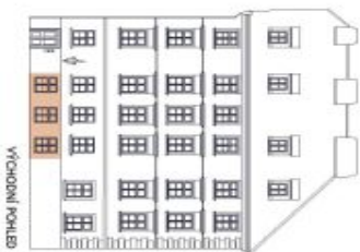
UMÍSTĚNÍ V RÁMCI PODLAŽÍ