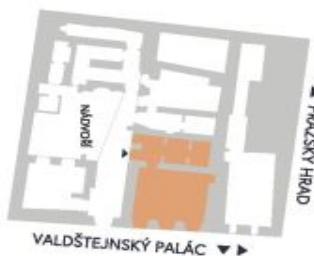
UMÍSTĚNÍ V RÁMCI PATRA