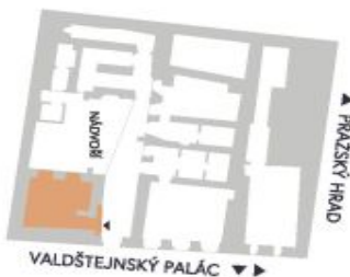
PRÁŽSKÝ HRAD VALDŠTEJNSKÝ PALÁC