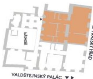
UMÍSTĚNÍ V RÁMCI PODLAŽÍ