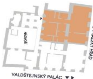
UMÍSTĚNÍ V RÁMCI PATRA