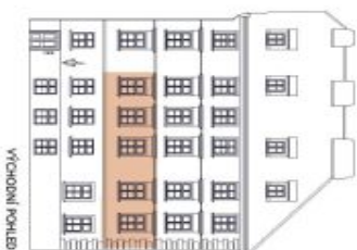
UMÍSTĚNÍ V RÁMCI PODLAŽÍ