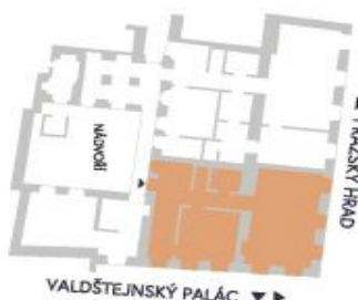
UMÍSTĚNÍ V RÁMCI PATRA