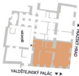
UMÍSTĚNÍ V RÁMCI PODLAŽÍ