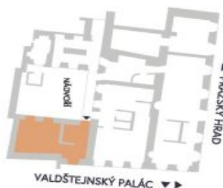
UMÍSTĚNÍ V RÁMCI PATRA