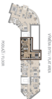
VÝMĚRA BYTU / FLAT AREA