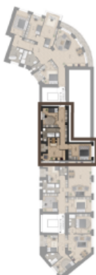
VMĚRA BYTU / FLAT AREA