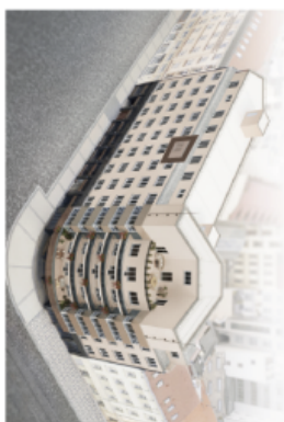
PODLAŽÍ / FLOOR