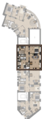
PODLAŽÍ / FLOOR