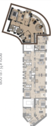
PODLAŽÍ / FLOOR