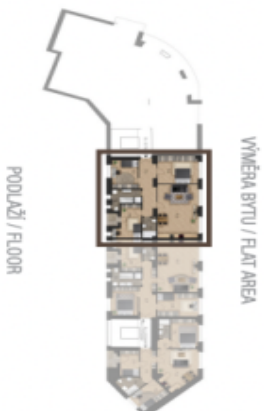
PODLAŽÍ / FLOOR