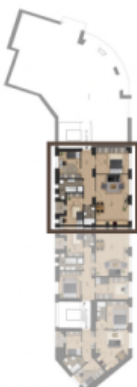
PODLAŽÍ / FLOOR