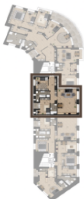
VÝMĚRA BYTU / FLAT AREA