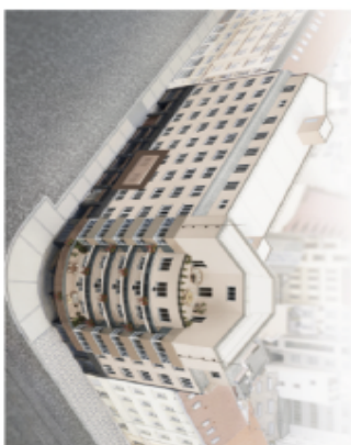
PODLAŽÍ / FLOOR