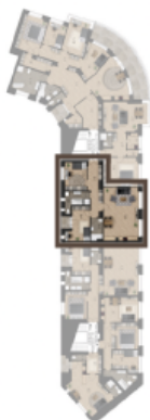
PODLAŽÍ / FLOOR