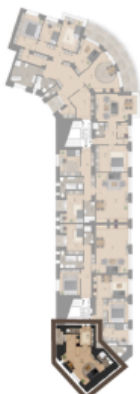
VÝMĚRA BYTU / FLAT AREA