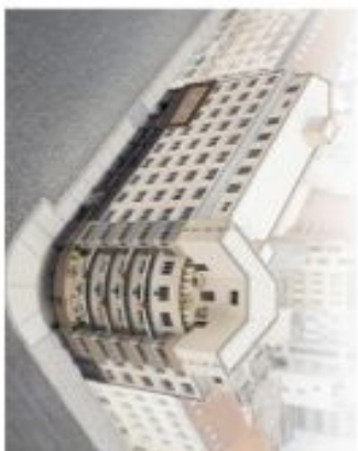
PODLAŽÍ / FLOOR