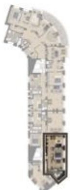
VÝMĚRA BYTU / FLAT AREA