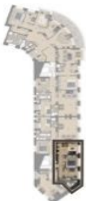
VÝMĚRA BYTU / FLAT AREA