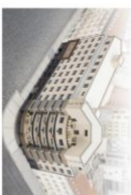
PODLAŽÍ / FLOOR