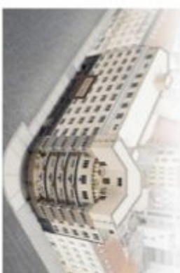
PODLAŽ / FLOOR