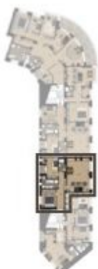
VÝMĚRA BYTU / FLAT AREA