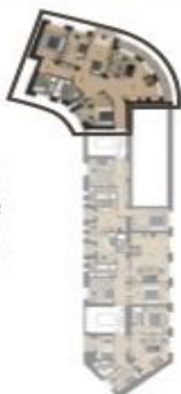
PODLAŽÍ / FLOOR