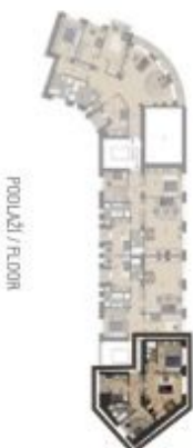
PODLAŽÍ / FLOOR