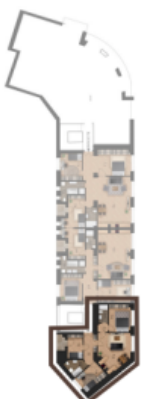
PODLAŽÍ / FLOOR