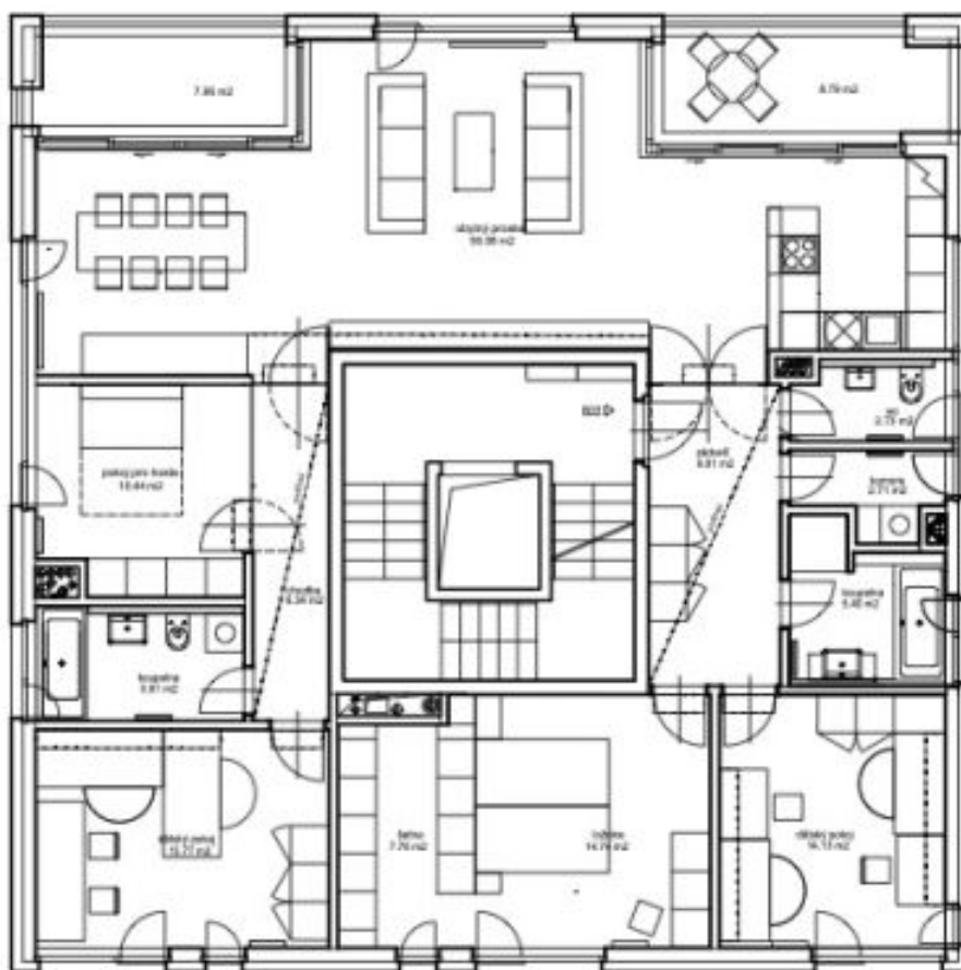
schéma bytu B21+B22 - 2np