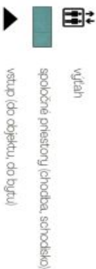
Schéma pôdorysu domu predstavuje dispozíciu resp. výstavbu bytu. Developer si vyhradzuje právo na zmenu a upresnenie bez predchádzajúceho upozornenia.