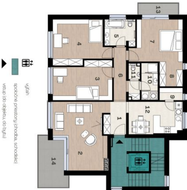
Schéma pôdorysu domu predstavuje dispozíciu niektorých priestorov bytu. Developer si vyhradzuje právo na zmeny a úpravy bez predstaviateľského upozornenia.