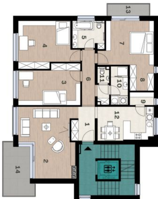
Schéma pôdorysu domu predstavuje dispozíciu nízkej rezidence bytu. Developer si vyhradzuje právo na zmeny a úpravy bez predbežnej dohody a upozornenia.