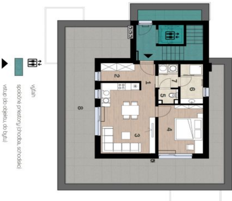
Schéma pôdorygu domu predstavuje dispozíciu resp. výstavbu bytu. Developer si vyhradzuje právo na zmenu a upresnenie bez predchádzajúceho upozornenia.