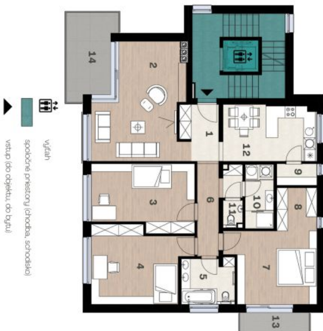
Schéma pôdorysu domu predstavuje dispozíciu niektorých bytů. Developer si vyhradzuje právo na zmenu a upresnenie bez predzvesti. Platí upozornenie.