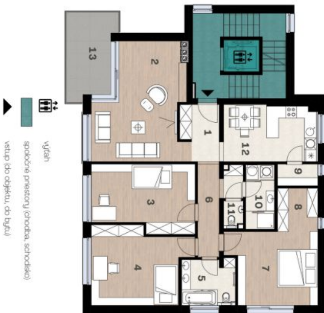
Schéma pôdorysu domu predstavuje dispozíciu niektorých bytů. Developer si vyhradzuje právo na zmeny a úpravy bez predbežnej dohody a upozornenia.