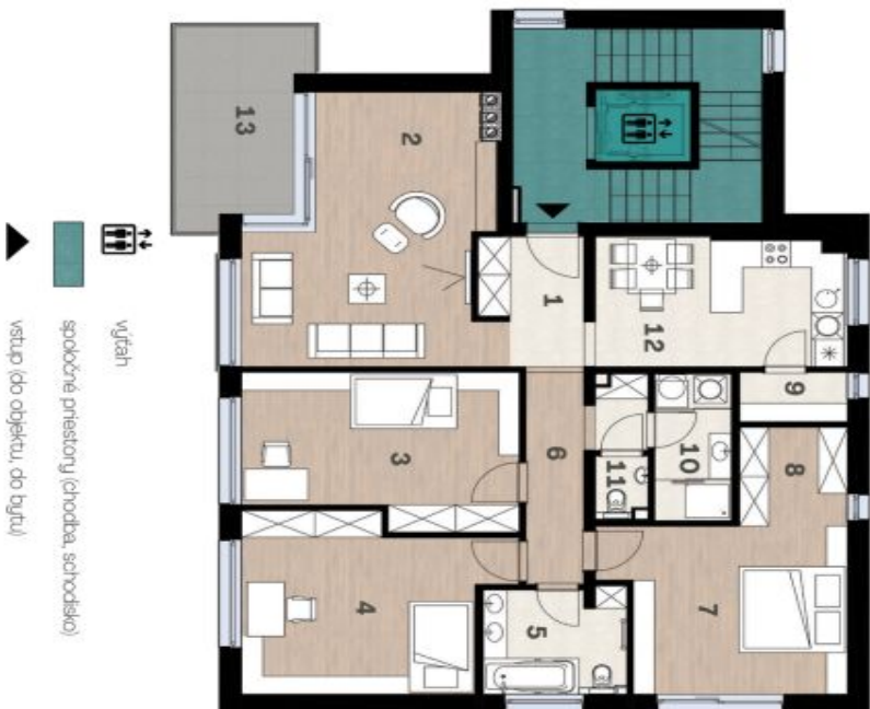
Schéma pôdorysu domu predstavuje dispozíciu resp. výstavbu bytu. Developer si vyhradzuje právo na zmenu a upresnenie bez predbežného upozornenia.