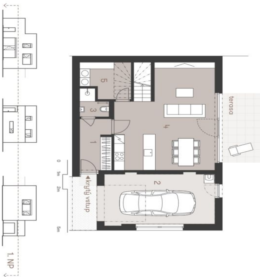
Schéma půdorysu domu představuje dispozici řešené domu. Kuchynská linka a nábytek nejsou součástí dodávky domu, zřítení je zahrnuto pouze pro názornost. Specifikace pro komunikace, povrchové úpravy a rozložení výhledů je předávaná přílohou "Standardní memořanda". Developer si vyhrazuje právo na změny a upřesnění bez předání každého upozornění.