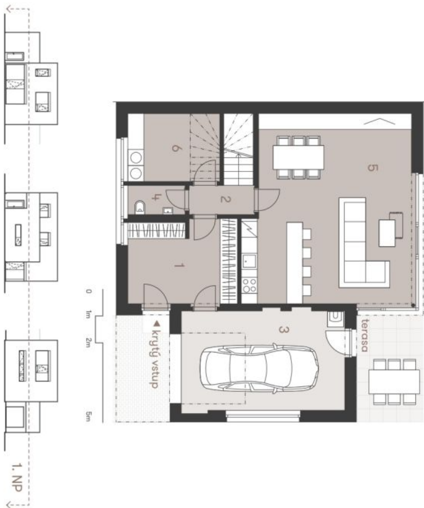
Schéma podlažní domu představuje sdílený plán domu. Každý nápis linka a odlišný nápis označuje část domu, například je zobrazeno pouze pro indikaci. Specifické pro každou část, povrchové úpravy a rozložení vybavení je předloženo graficky. "Standard" znamená "standard". Dovolíme si vyhradit právo na změny a upřesnění bez předložení upozornění.