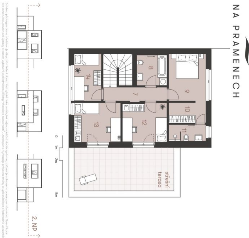
Schéma podlahy 2. patra domu představuje ideální řešení domu. Každý z pokojů má vlastní vstupní dveře, což zajišťuje soukromí a bezpečnost. Specifická podlahová konstrukce a povrchové úpravy v rozsahu výškově je předehledem příslušného "Developer" a výhledu práce na zřízení a upravení této příslušné úpravy.