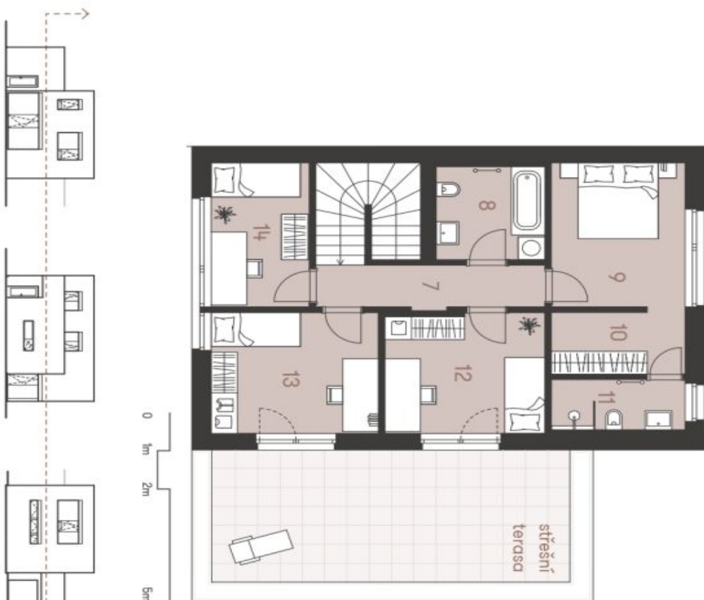
Schéma podlahy domu představuje doporučené řešení domu. Kuchynská linka a nábýtkel nejsou součástí dodávky domu, zařízení je zobrazeno pouze pro názornost. Specifikace pro konstrukci, povrchové úpravy a rozahřívání je předehem přílohy "Standard memorizací". Developer si vyhrazuje právo na změny a upřesnění bez předehého upozornění.