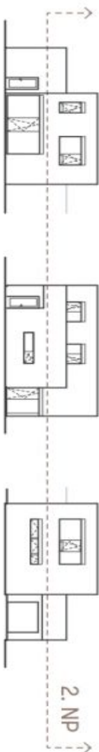
Schéma půdorysu domu představuje dispozici všech domů. Kuchyně, jídelna a obývací pokoj jsou společně dovedeny do domu, zatímco je zahrneno pouze pro nástropní. Specifikace pro konstrukci, povrchové úpravy a rozložení výhledů je předmětem přílohy "Standardní rekonstrukce". Developer si vyhrazuje právo na změny a úpravy bez předchozího upozornění.