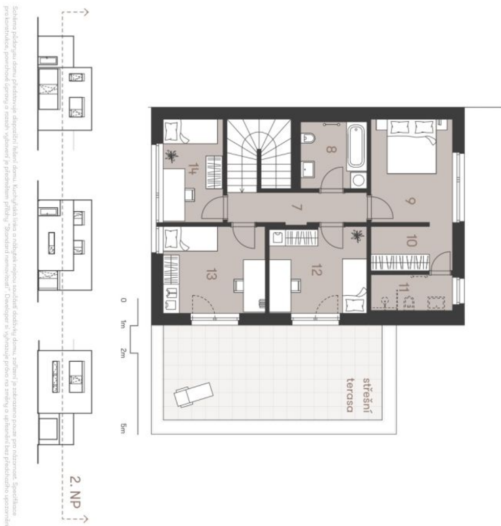
Schéma podlažia domu predstavuje dispozíciu všetkých miestností domu. Každá čiarka línia a rohučik má svoju súvisiacu dachovú líniu, zatiaľ čo zachované pozemky predstavujú špecifické pozemkové územie, pozemkové územie a rozloženie výhledů a rozložení výhledů. Developer si vyhradzuje právo na zmeny a úpravy bez predchádzajúceho upozornenia.