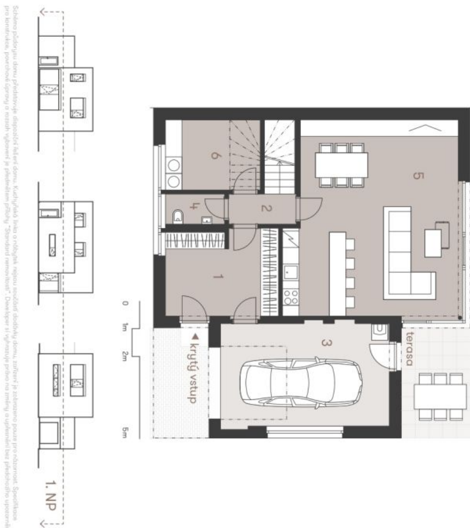
Schéma podlahy domu představuje dispozici včetně domu. Kuchynská linka a volněležící regány rozdělí obývací část, zatímco je zachováno prostore pro nástropce. Specifické pro tento dům, pozice dle dispozice a rozložení je předpokládána. Standardní rozměry: "Deklarace a výměry pro stavbu a údržbu" bez předpokladu úpravy.