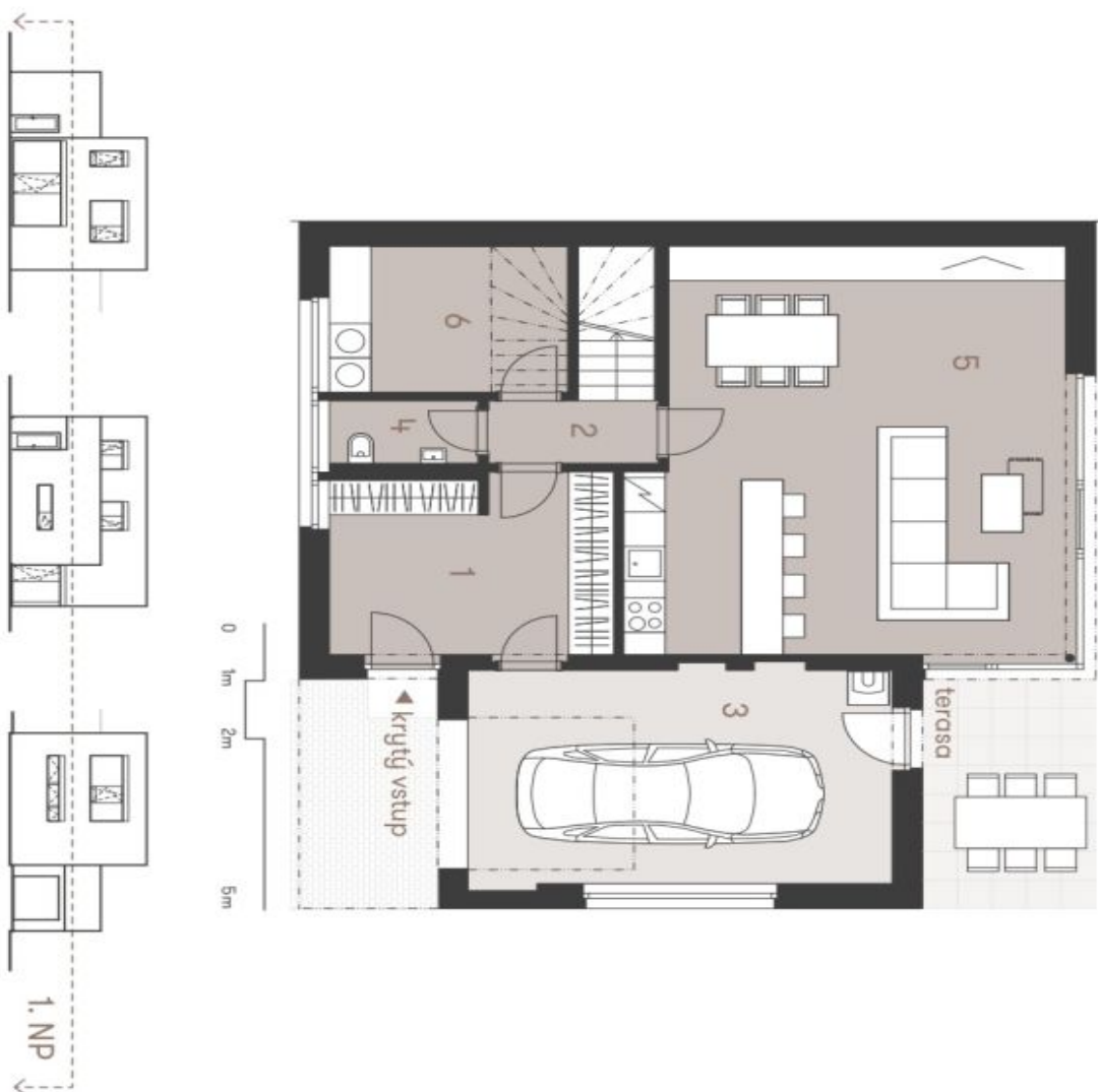
Schéma přílohy je pouze orientační a nepředstavuje skutečný stav domu. Každý údaj uvedený v schématu je pouze orientační a nepředstavuje skutečný stav domu. Schéma je zobrazeno pouze pro informaci. Specifikace pro jednotlivé části domu, včetně vybavení a materiálů, je uvedená v příloze. Dávající si výhradu práva na změny a upřesnění bez předchozího upozornění.