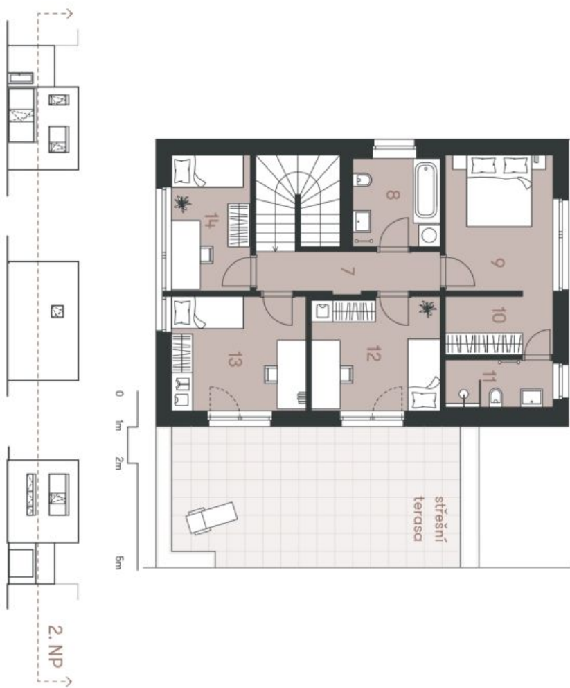
Schéma podlahy 2. NP domu představuje úpravitelný plán domu. Kuchynská linka a nábytkové řešení součástí dobovy domu, zatímco je zobrazeno pouze pro referenci. Specifikace pro kování, lince, povrchové úpravy a rozích vložení je předehlem přílohy "Standard nemovitosti". Developer si vyhrazuje právo na změny a upřesnění bez předehleho upozornění.