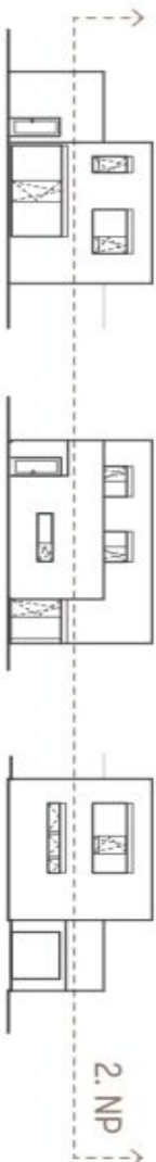
Schéma přidržuje domu představuje dispozici řádku domu. Kuchynská linka a nábytková sestava součástí dodávky domu, zbytek je zabezrazeno pouze pro informaci. Specifikace pro konstrukci, povrchové úpravy a rozložení výtahů je předmětem přílohy "Standardi rekonstrukce". Developer si vyhrazuje právo na změny a úpravení bez předchozího upozornění.