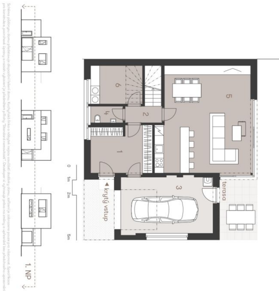
Schéma podlahy domu představuje dispozici (řazení) místností. Kuchynská linka a obývací nábytek nejsou součástí dispozice domu, zůstávají je zabudované pouze pro odměnu. Specifické prvky interiéru, povrchové úpravy a rozložení výhledů je předem nastaveno přílohou "Standard nemovitosti". Developer si vyhrazuje právo na změny a úpravy bez předchozího upozornění.