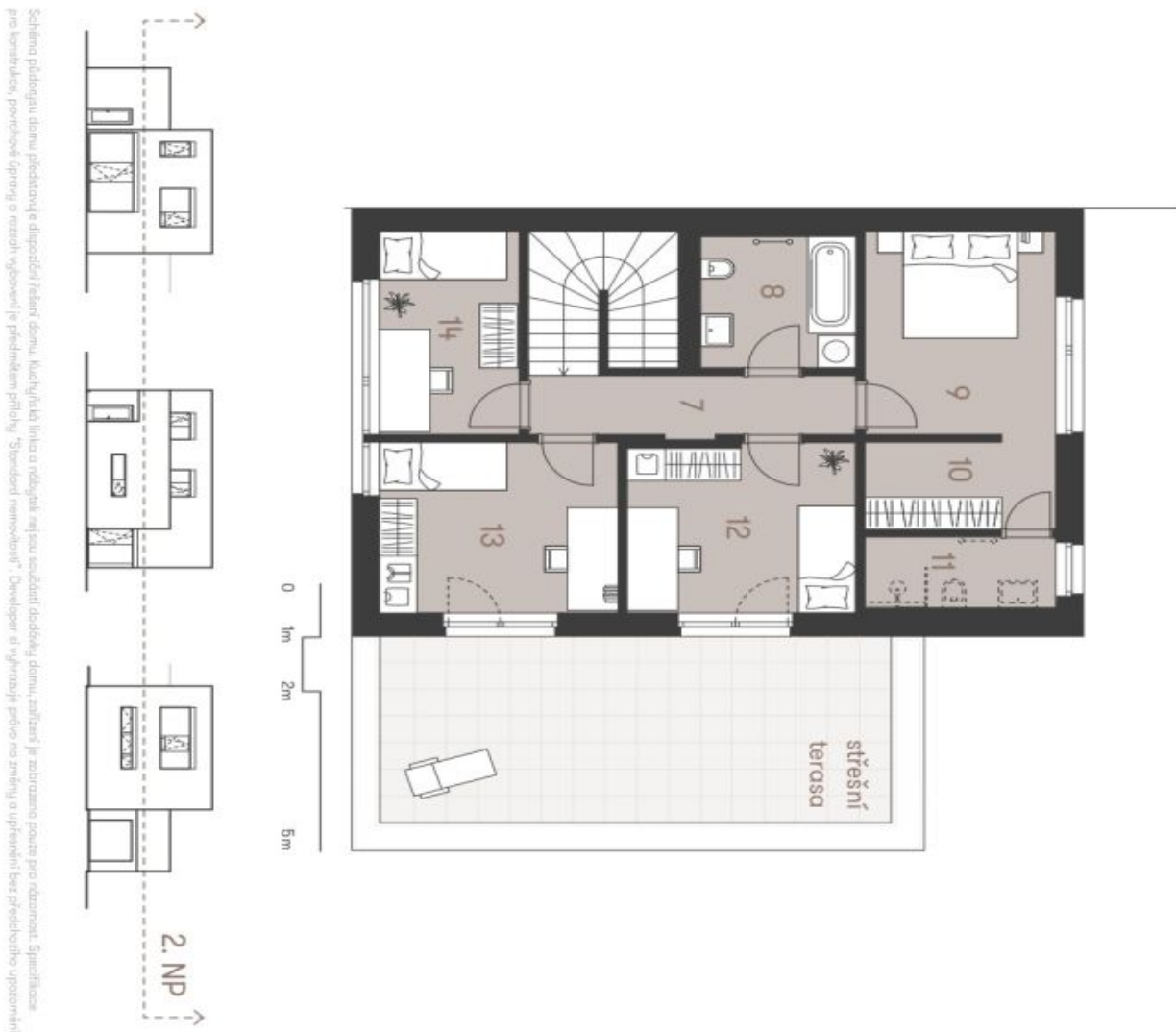
Schéma půdorysu domu předloženo a dispoziční řešení domu, který má být tímto a rodinný dům, zajišťuje se zabráněno pouze pro rezidenční. Společnost pro konstruktivní, povrchové úpravy a různé výhledové řešení předložené přílohy "Standard nemovitosti". Developer si vyhrazuje právo na změny a upřesnění bez předchozího upozornění.