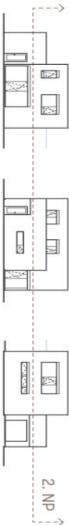
Schéma podlažní domu představuje dispozici včetně domu. Každý nápis řádu a nábytku nejsou součástí dobového domu, zřízení je zobrazeno pouze pro názornost. Specifikace pro kotevku, povrchové úpravy a rozložení je předkládan přílohy. Standardi nemovitosti: Developer si vyhrazuje právo na změny a upřesnění bez předchozího upozornění.