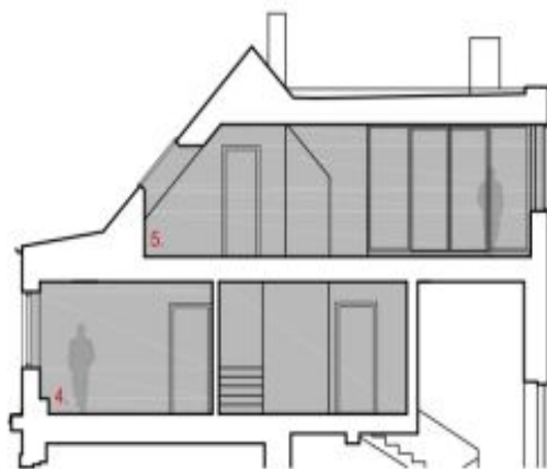
LEGENDA / LEGEND