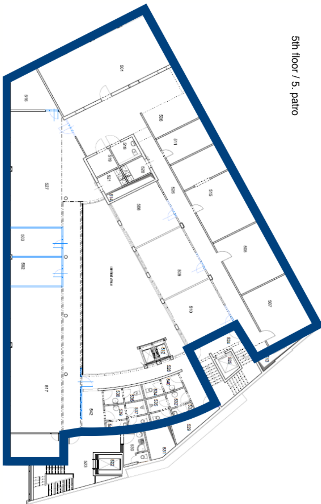
5th floor / 5. patro