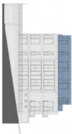
POHLED NA DŮM