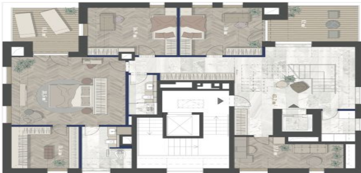
2. NP 2ND FLOOR