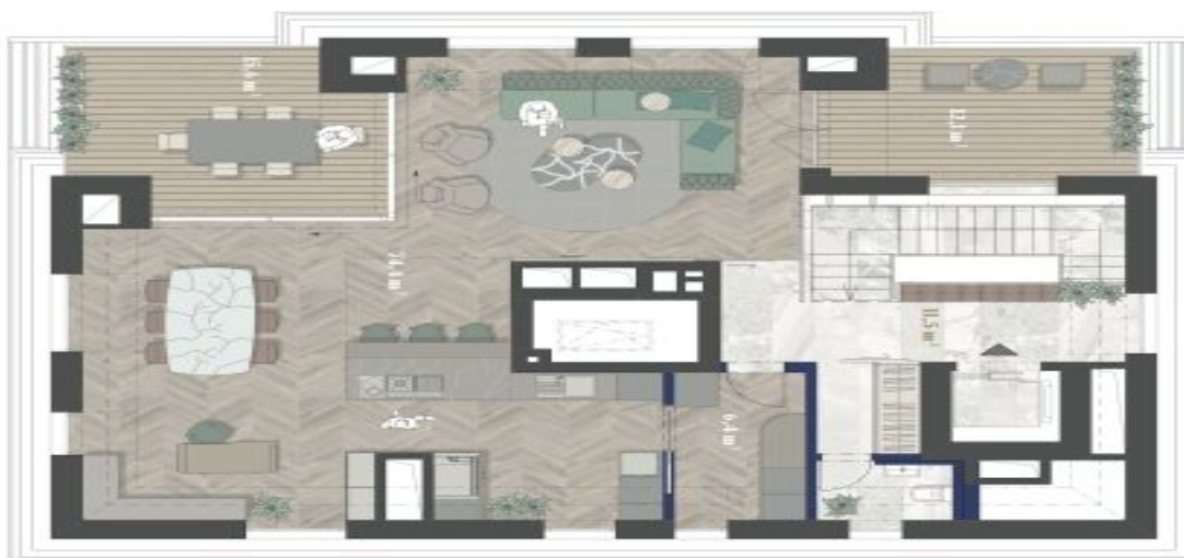
1. NP 1ST FLOOR