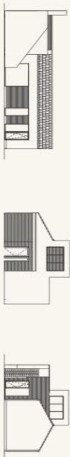
Schéma půdorysu domu představuje dispozici řešení domu. Kuchynská linka a nábytek nejsou součástí dodávky domu, zřízení je zahrnuto pouze pro názornost. Specifikace pro konstrukce, povrchové úpravy a rozsoch výtvarení je předmětem přílohy "Standard nemovitosti". Dávající si výhradně právo na změny a upřesnění bez předchozího upozornění!