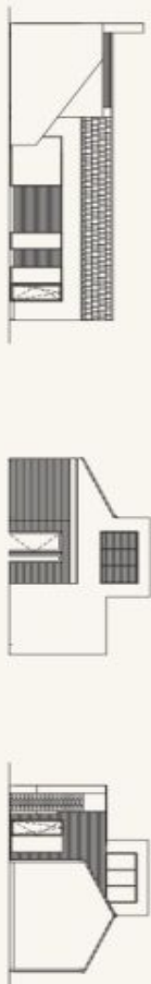
Schéma půdorysu domu představuje dispozici řešení domu. Kuchynská linka a nábytek nejsou součástí dodávky domu, zřízení je zahrnuto pouze pro názornost. Specifikace pro konstrukci, povrchové úpravy a rozsochí vybavení je předmětem přílohy "Standard nemovitosti". Dávající si výrazuje právo na změny a upřesnění bez předchozího upozornění!