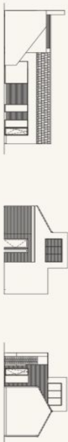
Schéma půdorysu domu představuje dispozici řešení domu. Kuchynská linka a nábytek nejsou součástí dodávky domu, zřízení je zahrnuto pouze pro názornost. Specifikace pro konstrukce, povrchové úpravy a rozsoch výtvarně je předmětem přílohy "Standard nemovitosti". Dávající si výrazuje právo na změny a upřesnění bez předchozího upozornění!