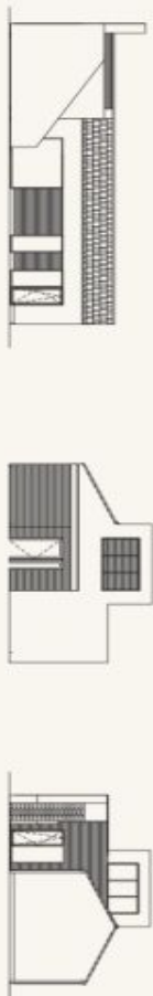
Schéma půdorysu domu představuje dispozici řešení domu. Kuchynská linka a nábytek nejsou součástí dodávky domu, zřízení je zahrnuto pouze pro názornost. Specifikace pro konstrukce, povrchové úpravy a rozsoch výtvarení je předmětem přílohy "Standard nemovitosti". Developer si vyhrazuje právo na změny a upřesnění bez předchozího upozornění!