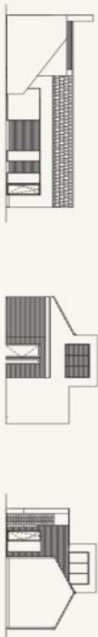
Schéma půdorysu domu představuje dispozici řešení domu. Kuchynská linka a nábytek nejsou součástí dodávky domu, zřízení je zahrnuto pouze pro názornost. Specifikace pro konstrukci, povrchové úpravy a rozsoch výtvarení je předmětem přílohy "Standard nemovitosti". Dávající si výrazuje právo na změny a upřesnění bez předchozího upozornění!